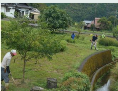
【フジバカマ園の整備】