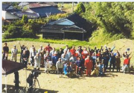
【草刈サミットの風景】