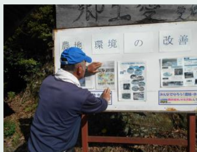
【広報看板への掲示】