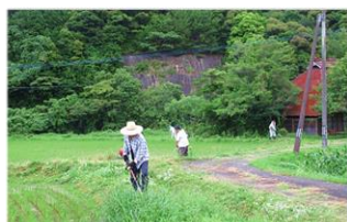
農道、水路等の草刈り