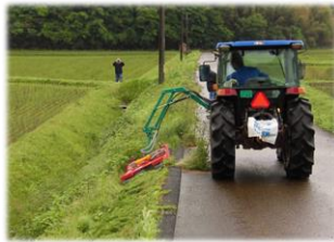
農道、水路等の草刈り