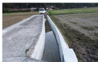
水路の補修・更新