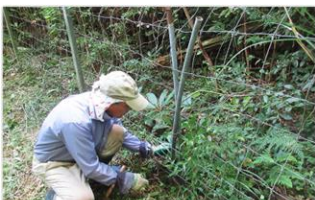
獣害防護柵の補修