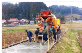
未舗装農道の舗装